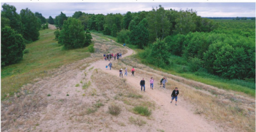
Grzędy - Wilcza Góra

Olbrzymi, dziki obszar charakteryzujący się mozaiką przeróżnych siedlisk, od bagiennych torfowisk przez olsy, bory i łąki, po piaszczyste wydmy i murawy nappłaskowe. To odwieczna ostoja wilka, łosia, ryśa oraz rzadkich gatunków ptaków i roślin. Jest to wiele różnego typu szlaków turystycznych i linii edukacyjnych. Funkcjonuje też Terenowy Ośrodek Edukacji BPN. Ośrodek Rehabilitacji Zwierząt oraz Ośrodek Hodowli Zachowawczej Konika Polskiego. Grzędy naczonne są piętnem walc patriotycznych Polaków i osadniczym zeszłościwie carskich z XIX wieku. Miejsce to zwano „Polskim Syberem”. Dawna wieś Grzędy, rozrzucona wśród lasów i wdm, przestała istnieć po 1945 r.