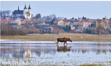
Widok na Białą Grąd

Goniądz to miasteczko położone w sercu BPN. Dawny pełnił funkcję portu rzecznego. Spławiano stąd produkty leśnej rolnie do Gąsawy. W mieście warto zobaczyć zachowany układ przestrzenny z dwoma rynkami z XIX-XVII w., neorokowy kościół pod wezwaniem św. Agnieszki, cmentarz katolicki z neogotycką kaplicą z 1907 roku, pozostałości po cmentarzu żydowskim i położona na wzniesieniu kapliczka św. Floriana z 1864 r. Na skarpie przy Domu Kultury znajduje się doskonały punkt widokowy z panoramą na dolinę Biebrzy. Za mostem, w odległości ok. 1 km, usytuowana jest wieża widokowa, z której widoczna jest mozaika łąk, pastwisk i zakrzaczek. Obserwować tu można rzadkiego orlika grubodziobego i wychodzące na łąki łosie.