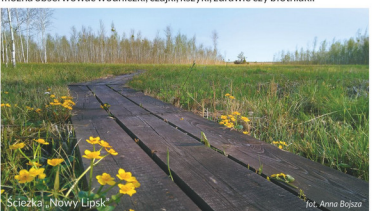
Ścieżka Nowy Lipsk

Znajduje się to najdłuższa w Biebrzańskim Parku Narodowym ścieżka edukacyjna (5 km dł.). Trasa, w formie kładki, wiezie w poprzek bagiennej doliny Biebrzy i przekracza rzekę za pomoca pływającego pomostu. Trasie dostępny, podmokły teren jest ostoją wielu cennych gatunków. Na trasie dostępna jest wieża czatownia oraz wieże i platformy widokowe, z których można obserwować wodniczki, czajki, kszki, żurawie czy błotniaki.