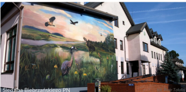
Siedziba Biebrzańskiego Parku Narodowego

W promieniu kilku km od siedziby BPN znajdują się 3 ścieżki edukacyjne z widokami widokowymi i olifantami. Ścieżka „Kładka” wiezie przez tereny podmokłe w bliskim sąsiedztwie rzeki Biebrzy. Ścieżka „Góra Skoła”, o tematyce historyczno-przyrodniczej, przebiega przez łąki i wzniesienie z przepięknym widokiem na dolinę Biebrzy. Ścieżka „Las w zasięgu ręki” jest najkrótsza, ale bogato wyposażona w edukacyjną infrastrukturę do poznawania leśnej przyrody oraz drewniane wiaty do odpoczynku. Przewodnik turystyczny zdrójczy tych ścieżek można zakupić w siedzibie Parku.