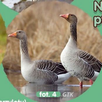
fot. 4 GTK