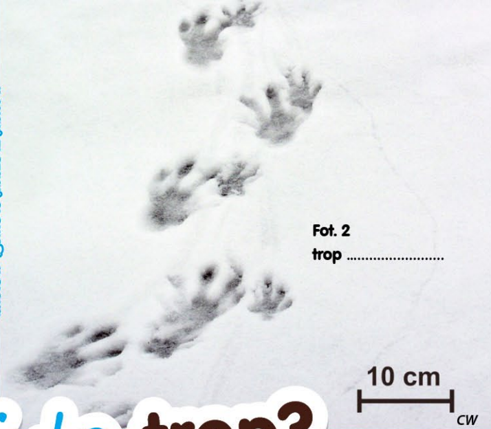
Fot. 2 trop .....