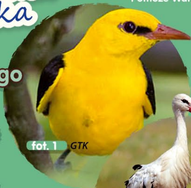
fot. 1 GTK