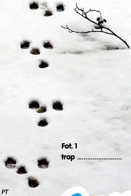
Fot. 1 trop .....