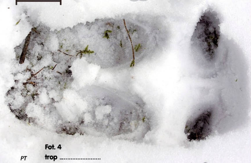
Fot. 4 trop .....