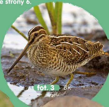
fot. 3 BK