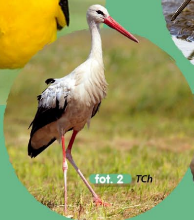
fot. 2 TCh