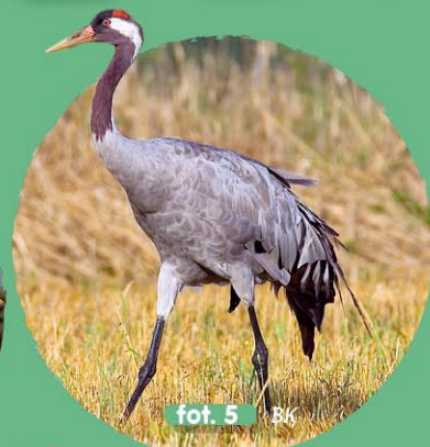
fot. 5 BK