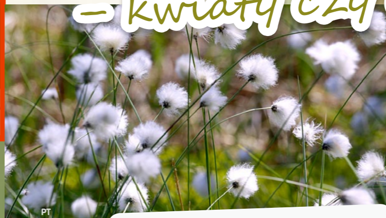
Fot. wielonośniki .....