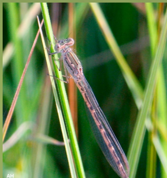
Odp. Nazwa tej ważki to: