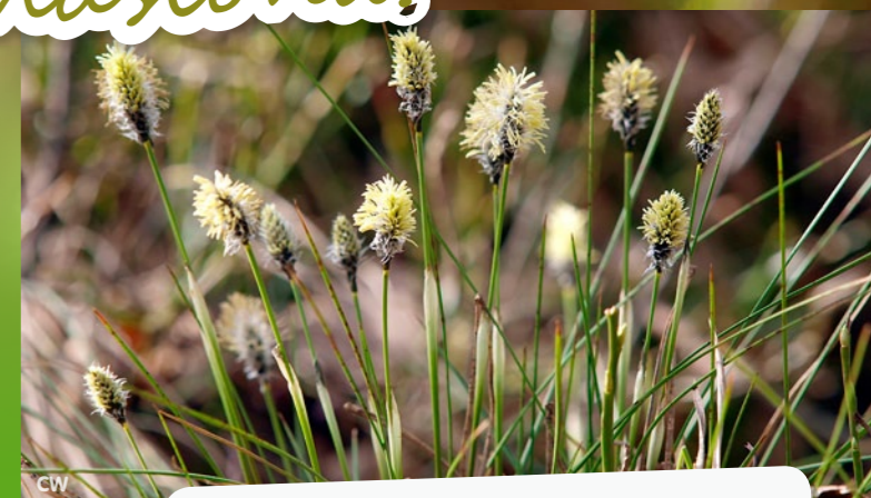
Fot. wielonośniki .....

W czerwcu wielonośniki tworzą puchowe łany. Czy wielonośniki wówczas kwitną czy owocują? Podpisz pod zdjęciem: wielonośniki kwitnące / wielonośniki owocujące