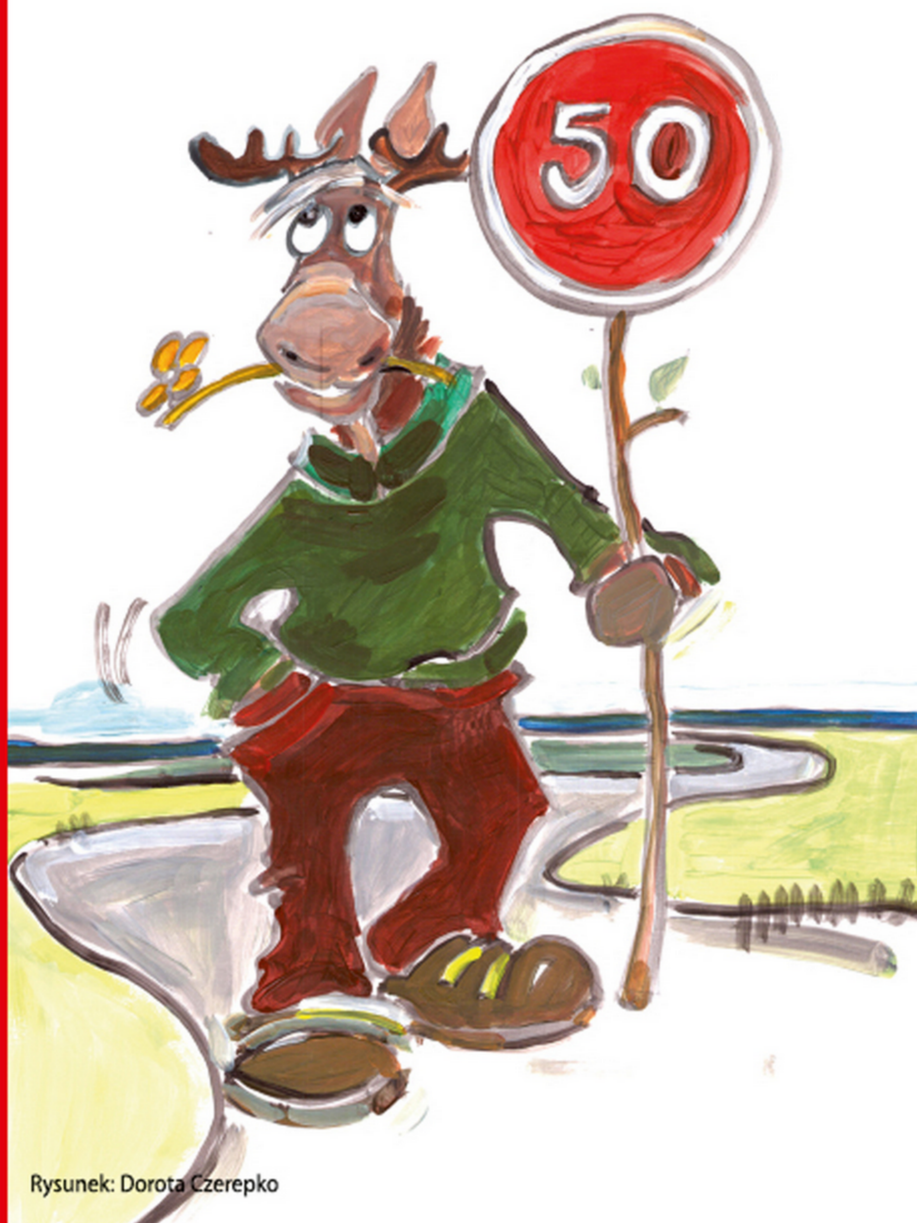
Rysunek: Dorota Czerepko