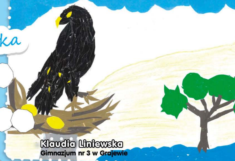
Klaudia Liniewska Gimnazjum nr 3 w Grajewie